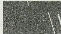
L'asteroide: sembra un puntino